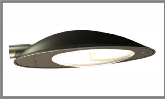
Luminaria DECO 01