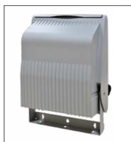
retro | atrás